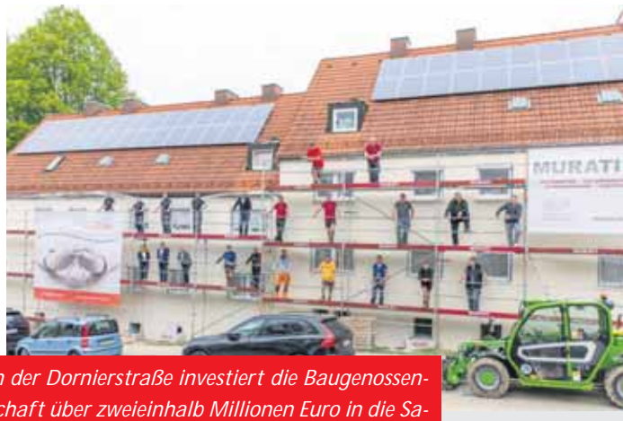
In der Dornierstraße investiert die Baugenossenschaft über zweieinhalb Millionen Euro in die Sanierung der Wohnanlage.